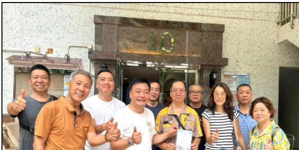
管委會,管理公司,顧問公司, 及承辦商進行新機試機。